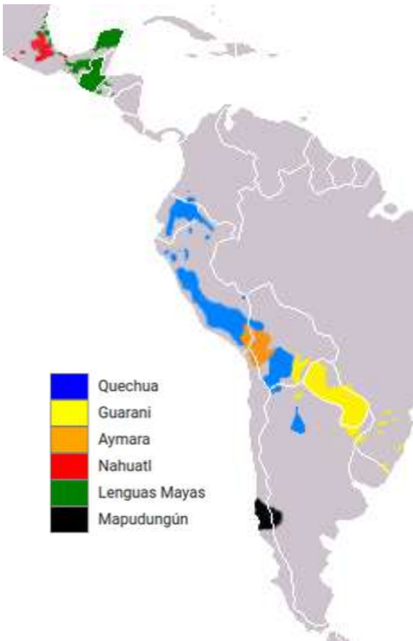
Linguas indigene plus parlate in Centro e Sud America

E in Tocantins, urbe Tocantínia, le idioma Xerente anque es majoritari.