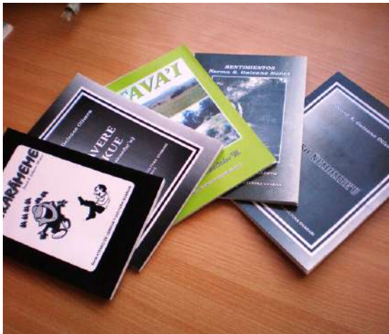
Libros in guarani

Le idioma guarani es official in Paraguay al latere del espaniol.